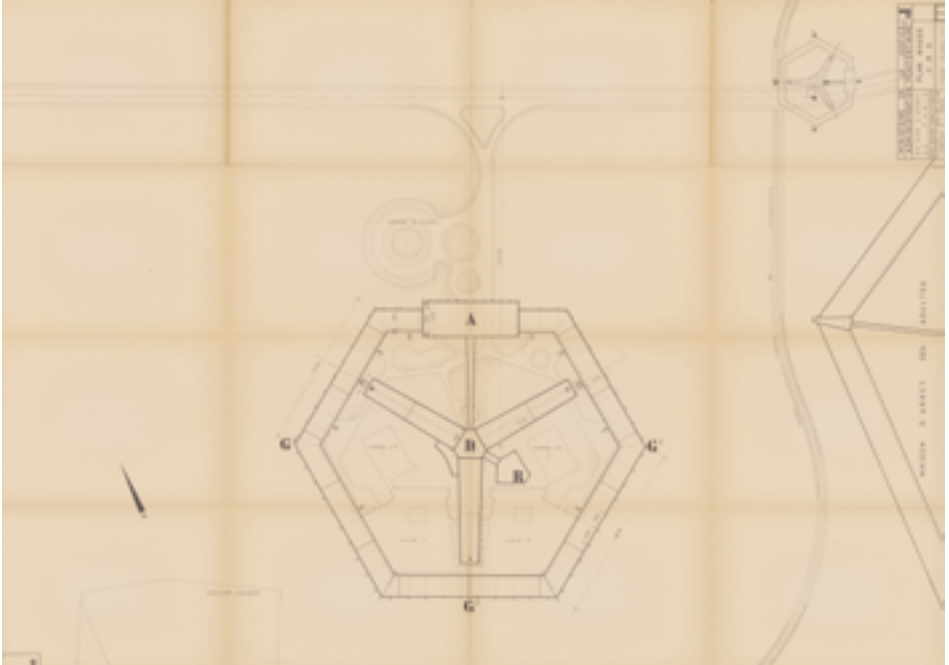
Figure 4. Plan du centre de jeunes détenus de Fleury-Mérogis, 1965, AN 19960148/155.

Le centre de jeunes détenus est néanmoins réservé exclusivement aux garçons. Les filles sont incarcérées à la maison d'arrêt des femmes de Fleury-Mérogis, ce qui permet la fermeture de la prison de la Roquette et du quartier de la maison d'arrêt de Fresnes où elles étaient incarcérées jusque-là (Figure 4) 73