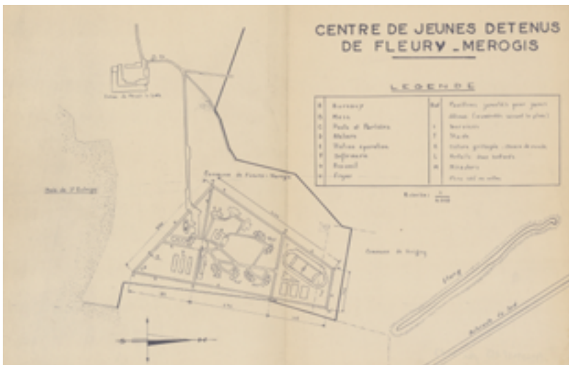
Figure 1. Plan du centre provisoire de jeunes détenus de Fleury-Mérogis, années 1960, AN 19960148/155.

Le personnel est constitué d'un directeur, d'un sous-directeur, de trois éducateurs, de deux enseignants détachés du ministère de l'Éducation nationale et de 28 surveillants. Les éducateurs sont donc