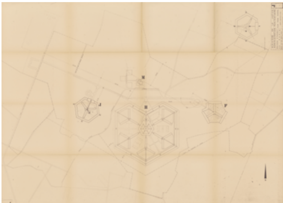
Figure 2. Plan de la maison d'arrêt de Fleury-Mérogis, 1965, AN 19960148/155.

Le projet architectural finalement retenu comprend un ensemble composé d'une maison d'arrêt et de correction pour hommes de 3 112 places, d'un centre de jeunes détenus de 516 places et d'une maison d'arrêt et de correction pour femmes de 380 places (Figure 2).